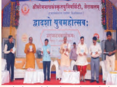
युवमहोत्सवोद्घाटनकार्यक्रमे मध्स्थे: महानुभावे: पुस्तकलोकार्पणम्

महाभागानां मार्गनिर्देशने टावरचौकतः विश्वविद्यालयपरिसरं पर्यन्तं सांस्कृतिकशोभायात्रा सम्पन्ना। अनया सह ध्वजारोहणकार्यक्रमः सर्वेषाम् अध्यापकानां, संयोजकानां निर्णायकमण्डलिप्रमुखानां कुलपतीनाश्च उपस्थितौ विश्वविद्यालयपरिसरे समजनि।