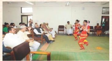
संस्कृतसप्ताहोत्सवस्य उद्घाटनकार्यक्रमे छात्रैः प्रस्तूयमानाः सांस्कृतिक कार्यक्रमाः