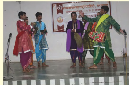
'कीचकवधम्' इति शीर्षकयुतायाः विशिष्टायाः उत्कललोककलायाः प्रदर्शनम्