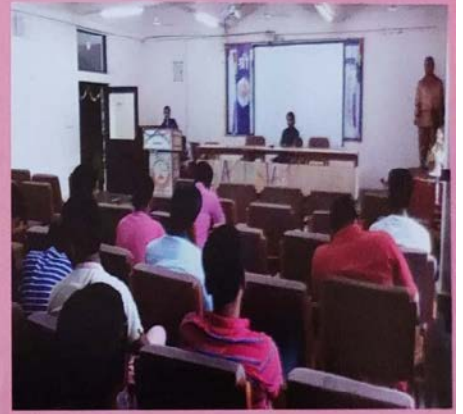
वाग्वर्धिनीसभायाः अधिवेशनस्य एकं दृश्यम्

वाग्वर्धिनीपरिषदियं प्रतिवर्षमिव अस्मिन् वर्षेऽपि २०१९-२०२० मान्यकुलपतिवर्याणां शुभाशीर्वचोभिः अनुस्नातकविभागाध्यक्षप्राचार्ययोः मार्गदर्शने १०.०७.२०१९ दिनाङ्के गुरुवासरे समारम्भात्। सभेयं प्रतिगुरुवासरं सायं ४.३० तः ६.०० वादनं यावत् विभिन्नविषयान् आश्रित्य प्रचलति। प्रत्येकस्मात् कक्ष्यातः छात्रद्वयस्य भागग्रहणाय अवकाशः भवति, योगविभागच्छात्राः तथा च तत्त्वाचार्यच्छात्राः अपि अत्र सोत्साहं भागग्रहणं कृत्वा विषयानुगुणं विद्वत्पूर्णभाषणैः स्ववाक्कौशलं प्रदर्शयन्ति। अस्याः सभायाः सञ्चालनादिकं सर्वमपि कार्यं स्वयं छात्राः निर्वहन्ति। प्रथमेऽस्मिन्सत्रे उद्घाटनसभया सह ५ सत्राणि अभवन्। प्रतिवर्षमिव